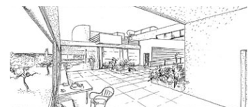
Skizze: Villa Savoye Le Corbusier