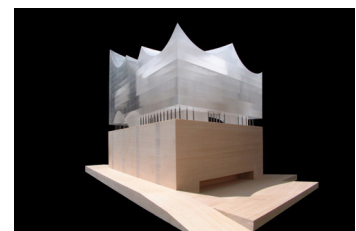
Modell: Elbphilharmonie Herzog & De Meuron