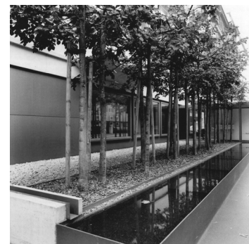
Gartenarchitektur Dieter Kienast