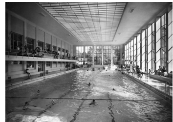
Hallenbad City Zürich Hermann Herter