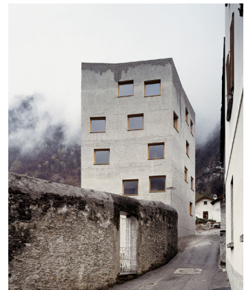
Villa Garbald Miller & Maranta

Wir wünschen Ihnen viel Erfolg. Januar 2019 - Die Kurskommission