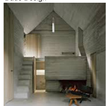
Umbau Casa d'Estade Buchner Bründler Architekten