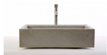
Beton-Badewanne Dade Design