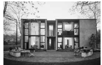
Esherick House, Louis Kahn