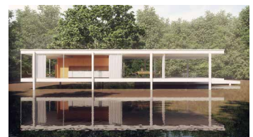
Farnsworth House, Mies van der Rohe