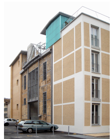
Lokomotive Winterthur Knapkiewicz & Fickert