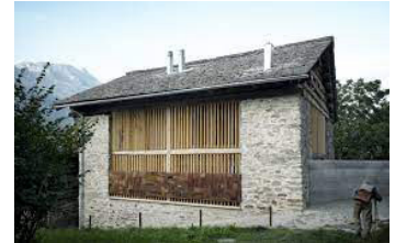
Umnutzung Stall Ruinelli - Associati